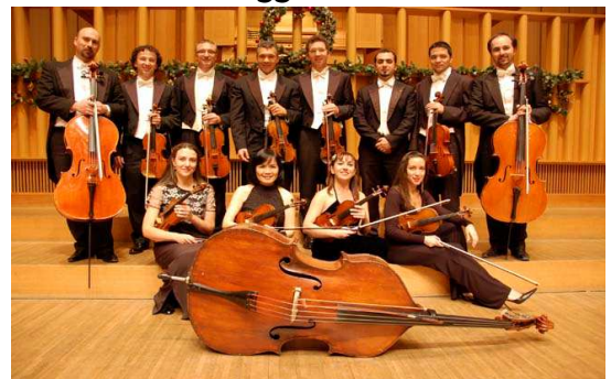
Una sezione di 12 archi

Così i violini entrarono nel mondo del Jazz, aprendo la via ad armonizzazioni che permettevano una alternanza di ritmi e una varietà di arrangiamenti capaci di stupire l'ascoltatore ad ogni frase musicale.