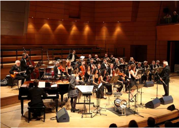
Il Galà del 21 marzo 2011.

Nell'età dell'oro del Jazz, la cosiddetta Era dello Swing, nell'America degli anni '30 e '40, gli organici delle Big Band avevano una dominanza di fiati: 5 sax, 4 trombe, 4 tromboni, più le ritmiche, la cui varietà poteva essere arricchita a piacere.